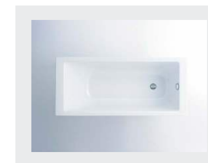
↑ BADEKAR Ifø badekar og brusekar.