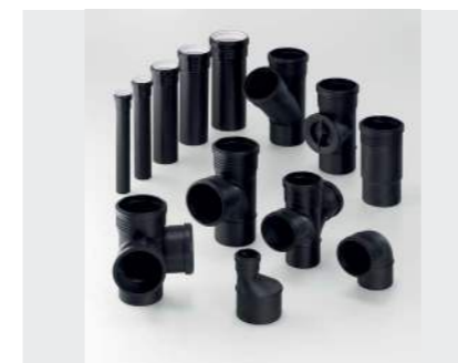
↑ AFLØBSSYSTEMER Afløbssystemer til alle behov. Silent-Pro, Silent-DB20, Silent-PP, PE og Pluvia.