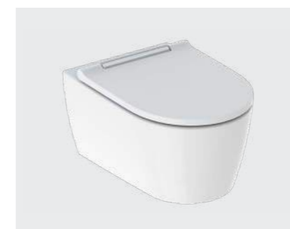
↑ GEBERIT SANITETSPRODUKTER Geberit væghængte toiletter, urinaler og håndvaske.