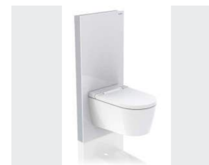
↑ MONOLITH Cisternemodul til både gulvstående og væghængte toiletter.