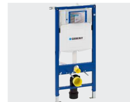
↑ INSTALLATIONSSYSTEMER Geberit Duofix indbygningssystemer og GIS installationssystemer.