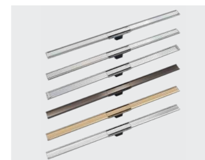
↑ GULVAFLØB CleanLine afløbsrønder og væg afløb.