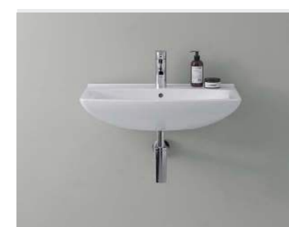
↑ IFØ SANITETSPRODUKTER Ifø gulvstående og væghængte toiletter samt håndvaske.